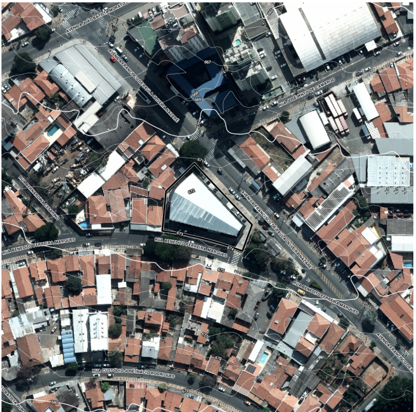
Ortofoto PMC Campinas - Jul/2014 - Situação sem escala