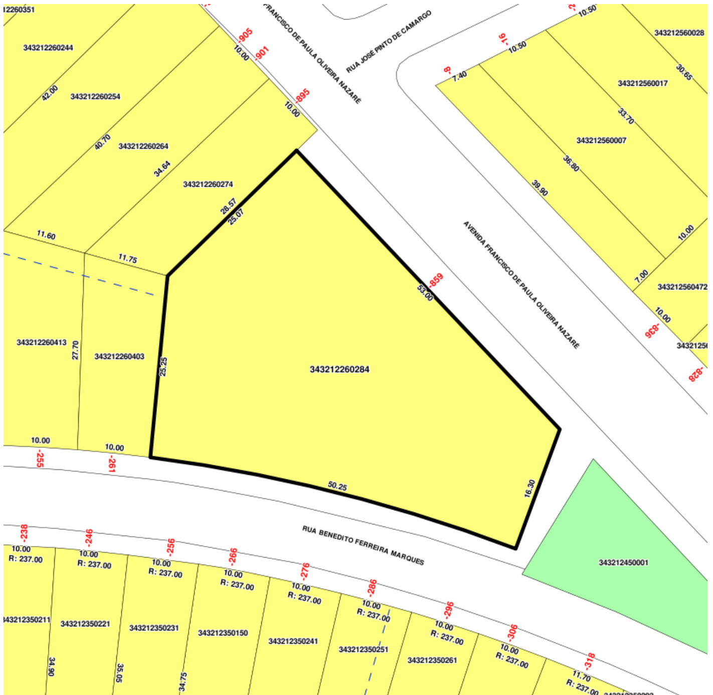
Situação da propriedade sem escala